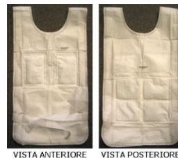
VISTA ANTERIORE VISTA POSTERIORE

Indumento per la protezione dell'operatore in situazioni di emergenza. Leggero, compatto ed in taglia unica può essere facilmente trasportato in ogni borsa o zaino.