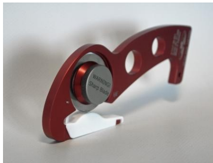
Disponibile anche nella versione "MINI", caratterizzata da peso ed ingombro inferiore.