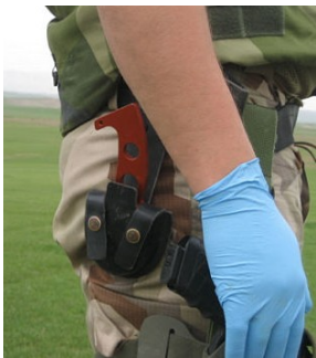
Il "Belt Clip", supporto per cintura, ne permette un pratico e sicuro trasporto